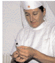
Alberta – infermiera