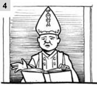
4 Quest... è Papa Giovanni Paolo II. È polacc....