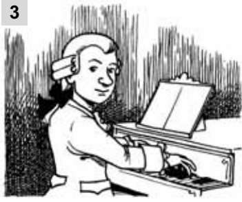
3 Quest... è Wolfgang Amadeus Mozart. È austriac....