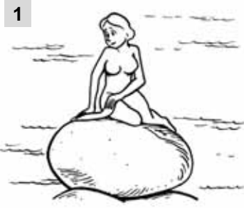
1 Quest... è la Sirenetta. È danes....