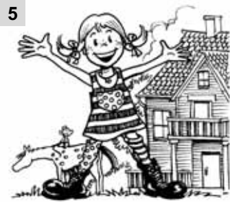
5 Quest... è Pippi Calzelunghe. È svedes....