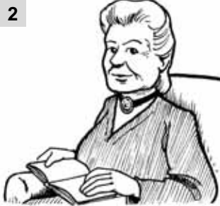
2 Quest... è Maria Montessori. È italian....