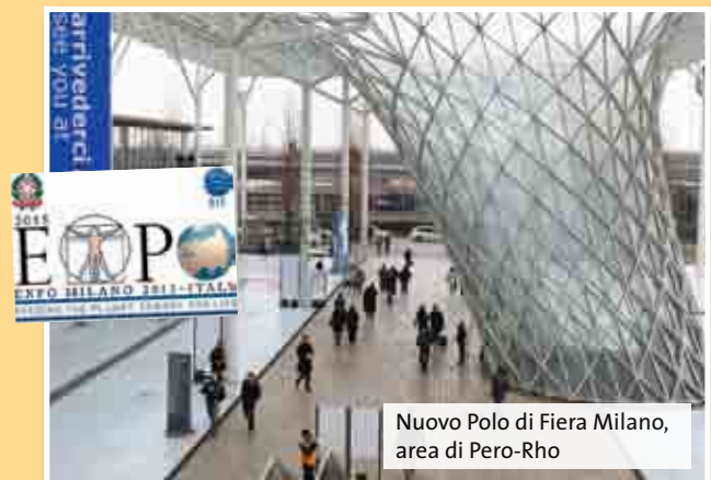
Nuovo Polo di Fiera Milano, area di Pero-Rho