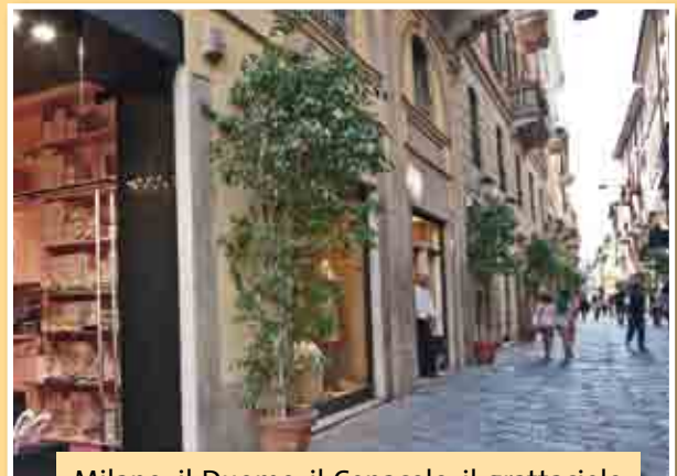
Milano: il Duomo, il Cenacolo, il grattacielo Pirelli, il celebre Quadrilatero della moda, la vita frenetica, lo smog ...

The Cube (foto in alto) è il nome scelto per l'edificio che ospita il centro di alta formazione. Progettato dall'architetto Pierluigi Nicolini, ha un'altezza di 30 metri, ben cinque piani, e copre una superficie di 9000 mq.