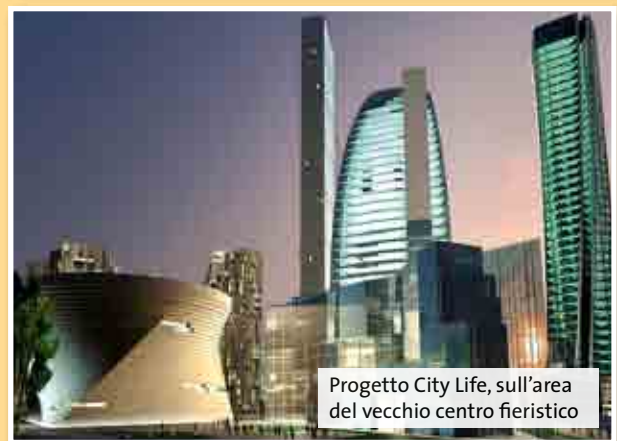
Progetto City Life, sull'area del vecchio centro fieristico

21 Che cosa collegate alla città di Milano? Completate la lista in alto a destra.